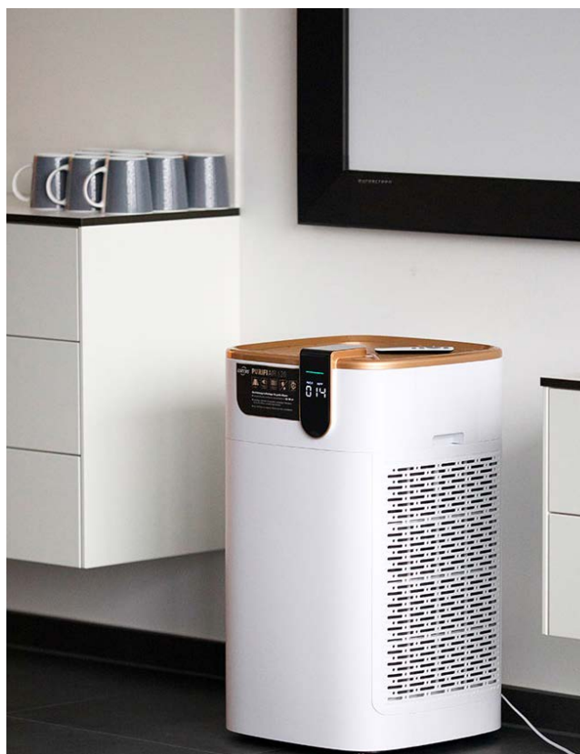
Notwendige Filterwechsel werden über das Display angezeigt.

Im Lieferumfang enthalten sind der Luftreiniger inkl. Fernbedienung, sowie die erste Mehrkomponenten-Filtereinheit.