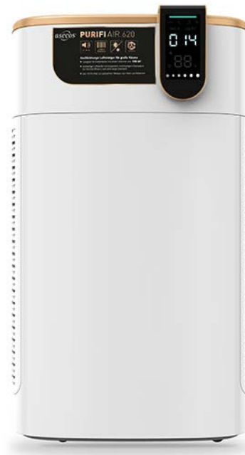
Die PURIFIAIR-Luftreiniger reduzieren maßgeblich Schadstoffbelastungen in Innenräumen.

Dank robuster Materialien und Bauweise, ist der Luftreiniger äußerst wartungsarm und verursacht niedrige Folgekosten. Die Filtermodule sind nutzerseitig problemlos austauschbar und können über den normalen Hausmüll entsorgt werden.